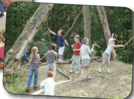
Classes de dépaysement

Un projet et une équipe au service de l'éducation, de la formation des enfants au regard de valeurs que nous vivons et proposons :