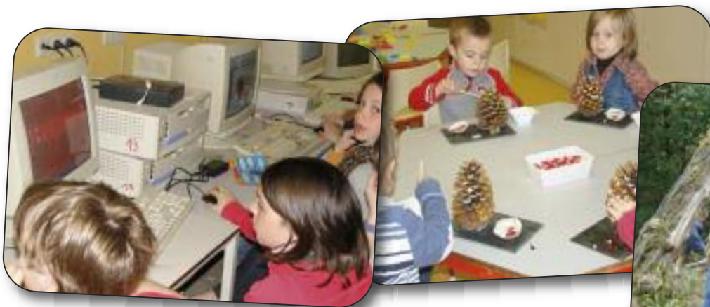
Cours d'informatique et de néerlandais en demi groupes